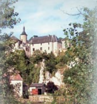
Château de La Roche à Gué St-Pierre-de-Maillé